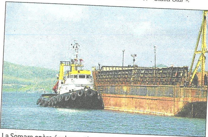
La Somara opère également la « Go 4 », une barge de 7 000 tonnes.

(1) Les « Friendship », « Alliance », « Touareg », « Massai », « Chieftan », « Lady Debbie » et « Statia Star ».